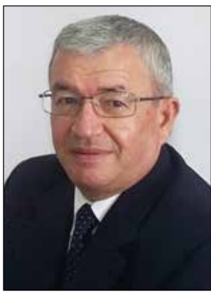
INTERVISTOI: BESNIK GJONBRATAJ